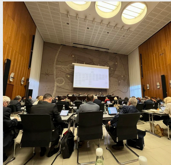
Zwei Tage der gemeinsamen Beratung im Bürgeraal

Nach zähem Ringen bei den Haushaltsberatungen haben wir den Haushalt letztlich mit gemischten Gefühlen verabschiedet. Wir haben immer noch ein Ausgabenproblem. In den nächsten Jahren müssen wir dringend weiter daran arbeiten, Aufgaben zu priorisieren und mit der entsprechenden Aufgabenkritik weitere Einsparungen diskutieren. Wir müssen uns von Aufgaben trennen, die nicht von einer Kommune getragen werden müssen.