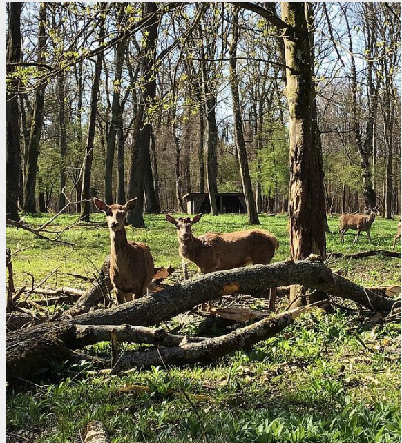
Eines der Wildtiergehege, die rückgebaut werden sollen (Wildtiergehege Rappenwört)

Die gute Nachricht vorab: Die Verwaltung hat für das Wildtiergehege in Grünwettersbach zugesagt, ein Konzept für die Fortführung dieser Einrichtung zeitnah vorzuschlagen. Dabei sollen alle Chancen für die tierschutzrechtliche Möglichkeiten und die Kosten für eine zwingend erforderliche neue Zaunanlage geprüft werden. Es geht unter anderem auch darum, dass mit der Verwaltung des Naturparks „Schwarzwald Nord“ der Kontakt wegen Zuschussmöglichkeiten gesucht wird.