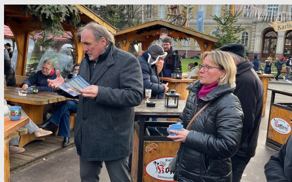
Die Fraktion informierte am Karls-Ruhe-Plätzle

richsplatz gerne erhalten und stehen zu der lieb gewonnenen Tradition. Daher haben wir uns am 19. Dezember zusammen mit den Marktbesckern getroffen und ausgetauscht.